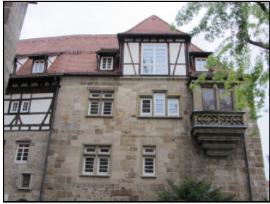
Außenansicht auf den Erker