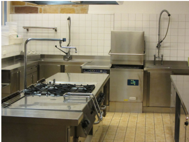
Küchenzeile Salemer Pfleghof