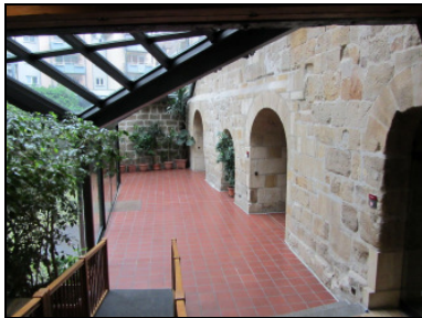
Blick in das Foyer