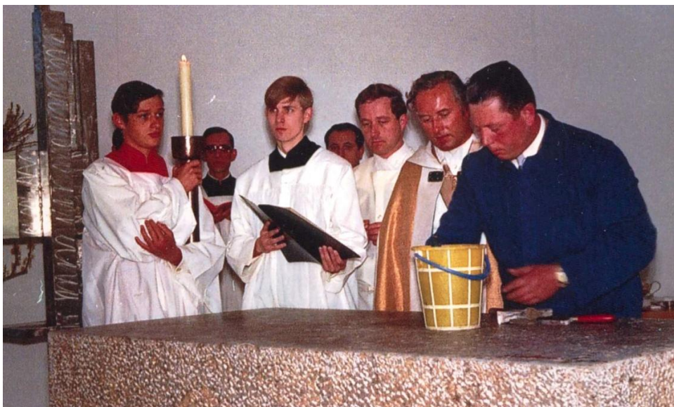
Weihe von St. Katharina am 20. April 1969

Kirchliche Mitteilungen der Katholischen Kirchengemeinde St. Paul / St. Katharina, Esslingen Nr. 3 / 19 01.04. – 31.05.2019